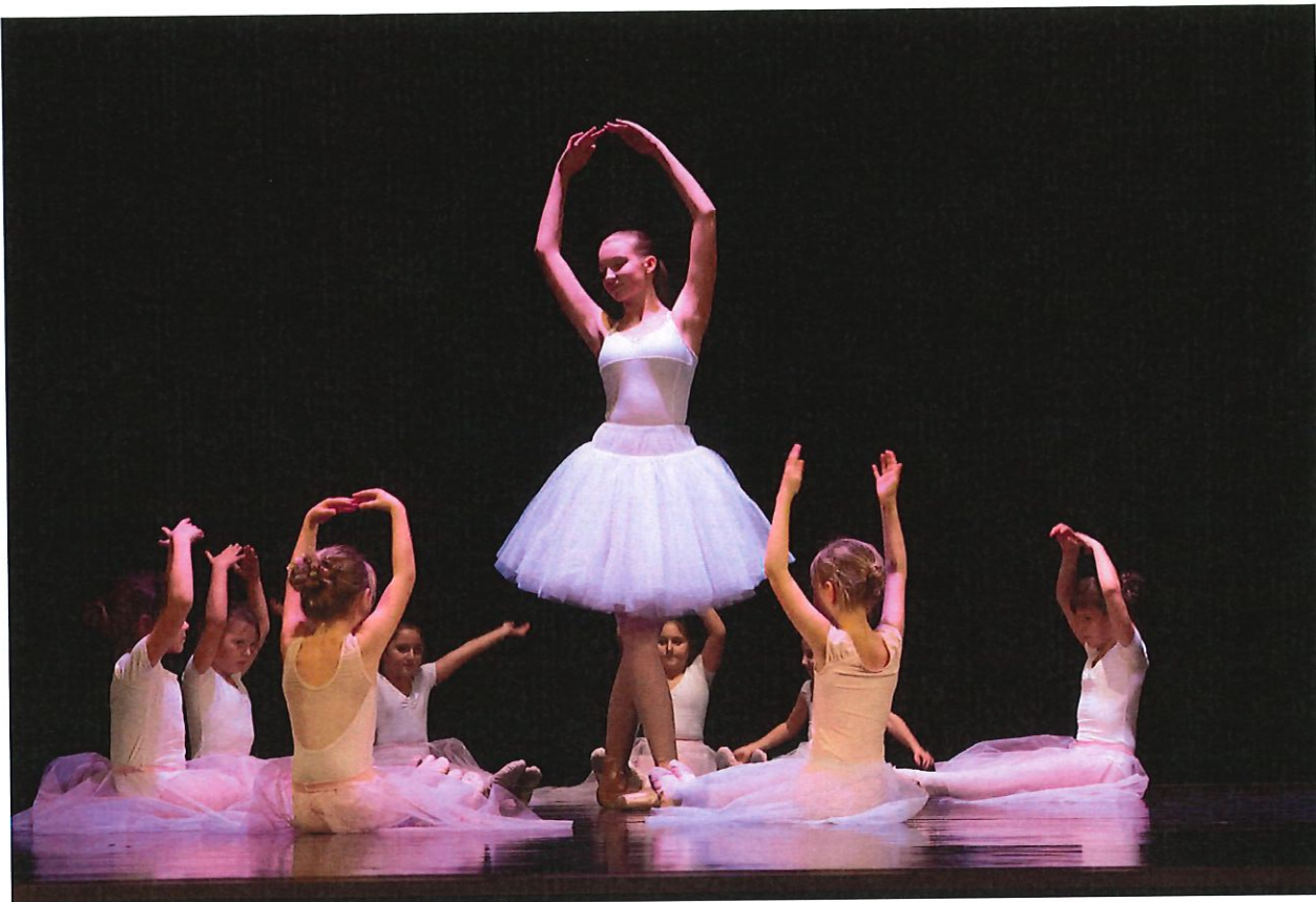
Z vystoupení tanečního oboru v programech pro veřejnost: Vánoční pohlázení a Tanec v srdci.