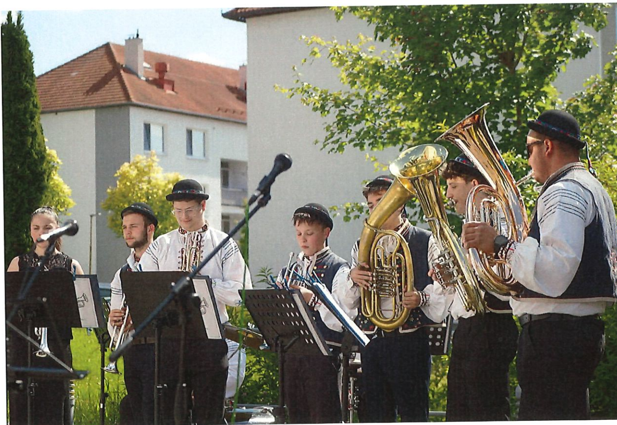
Vystoupení školní dechové kapely Horalenka v rámci Zahradní slavnosti ZUŠ

Pozn.: mezi hodnocené žáky nejsou započítáni děti z přípravného studia – podle vyhlášky nejsou ještě klasifikovány.